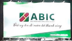
Trụ biễn quảng cáo của ABIC Tại Hà Nội