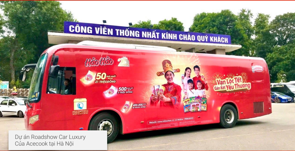
Dự án Roadshow Car Luxury Của Acecook tại Hà Nội