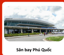
Sân bay Phú Quốc