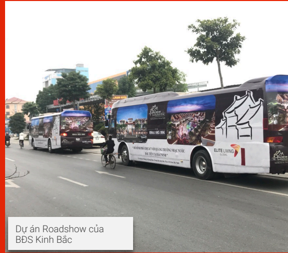
Dự án Roadshow của BĐS Kinh Bắc