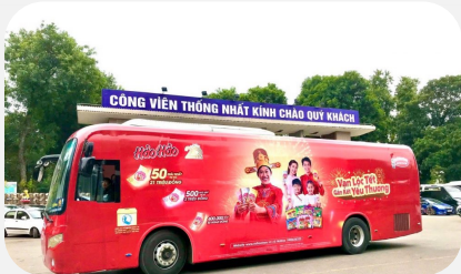
Roadshow Car Luxury