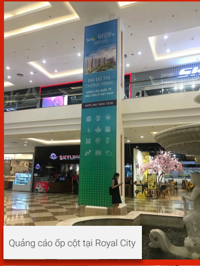
Quảng cáo ốp cột tại Royal City