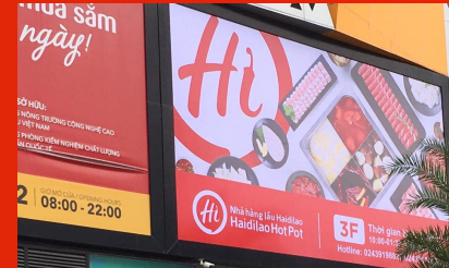
Billboard của Haidilao Tại Trung tâm thương mại