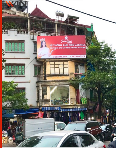
Billboard quảng cáo của Jaxtina tại Hà Nội