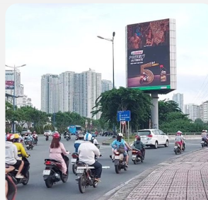
Màn LED đường phố