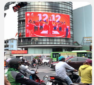
Màn LED tại tòa nhà