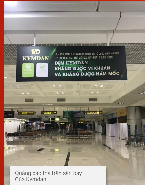
Quảng cáo thả trần sân bay Của Kymdan