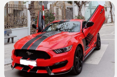
Roadshow siêu xe