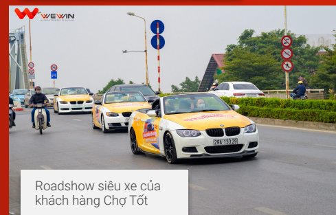
Roadshow siêu xe của khách hàng Chợ Tốt