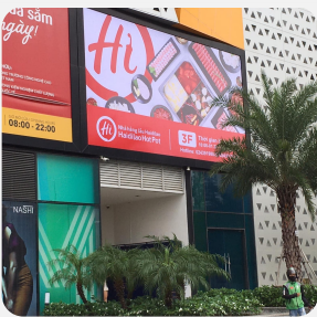
Pano, màn hình LED