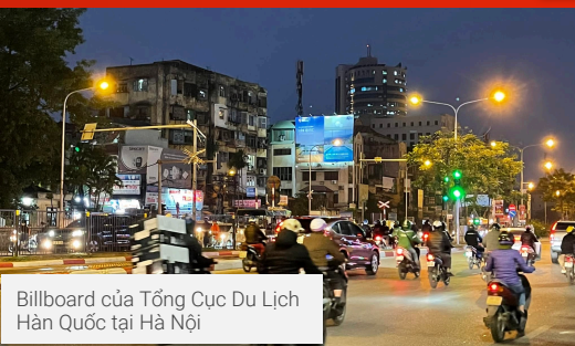
Billboard của Tổng Cục Du Lịch Hàn Quốc tại Hà Nội