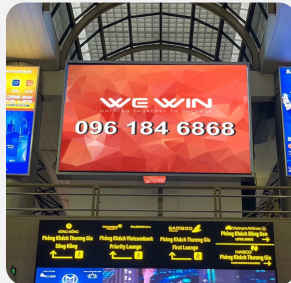
Quảng cáo LED, LCD