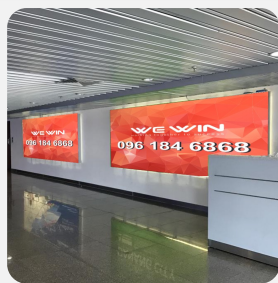
Quảng cáo hộp đèn