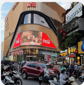
Màn hình LED tại TTTM