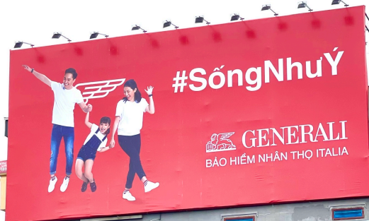
Billboard quảng cáo của Generali tại Hưng Yên