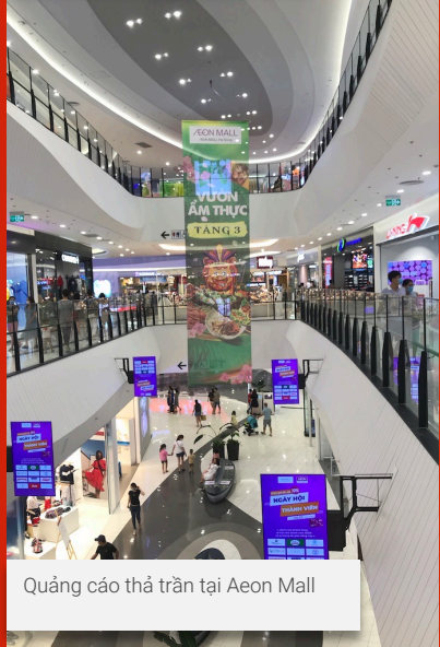
Quảng cáo thả trần tại Aeon Mall