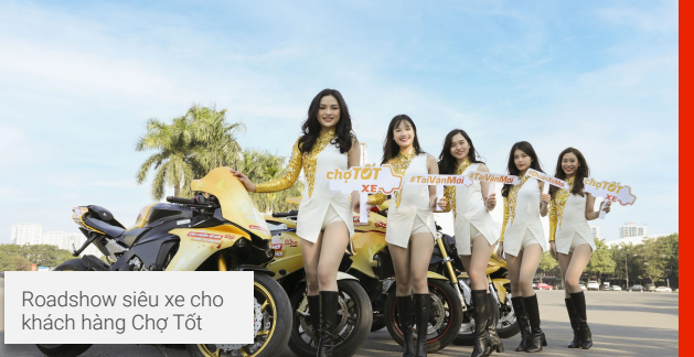
Roadshow siêu xe cho khách hàng Chợ Tốt