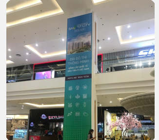
Quảng cáo thả trần