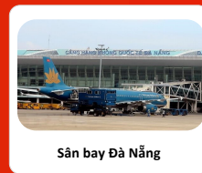
Sân bay Đà Nẵng