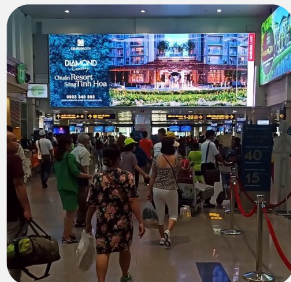
Màn LED tại sân bay