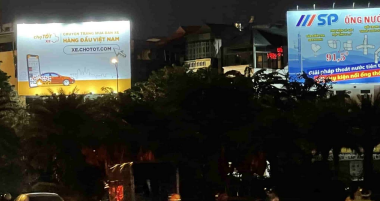
Billboard của Chợ Tốt Tại Hà Nội