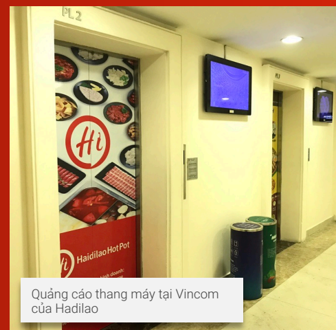
Quảng cáo thang máy tại Vincom của Hadilao