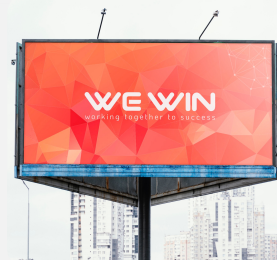
Biển quảng ba mặt