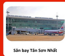
Sân bay Tân Sơn Nhất