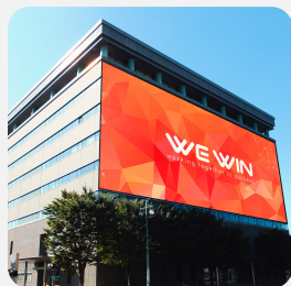
Biển quảng ốp tường