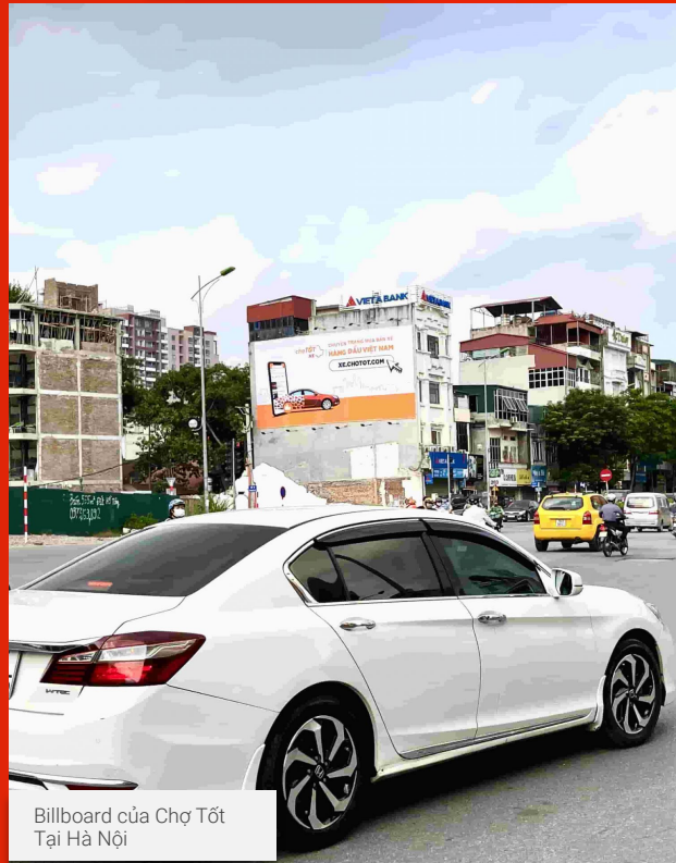
Billboard của Chợ Tốt Tại Hà Nội