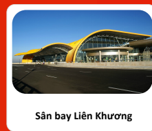
Sân bay Liên Khương