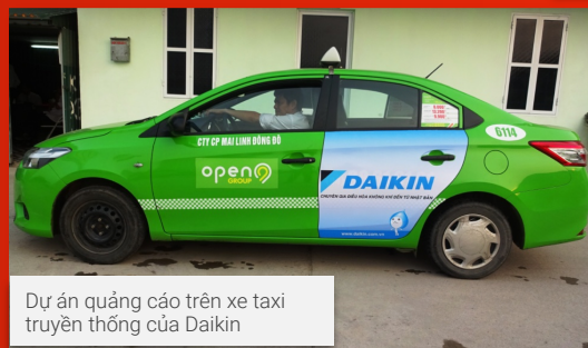
Dự án quảng cáo trên xe taxi truyền thông của Daikin