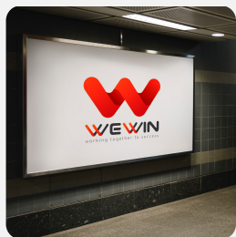
Biển quảng cáo một mặt