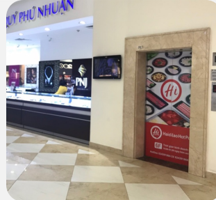
Quảng cáo thang máy