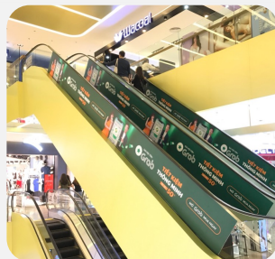
Quảng cáo thang cuốn