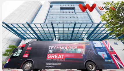
Roadshow xe Bus hai tầng