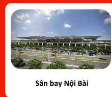
Sân bay Nội Bài