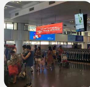
Quảng cáo thả trần