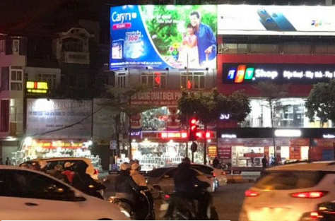
Billboard quảng cáo của Unicharm tại Hà Nội