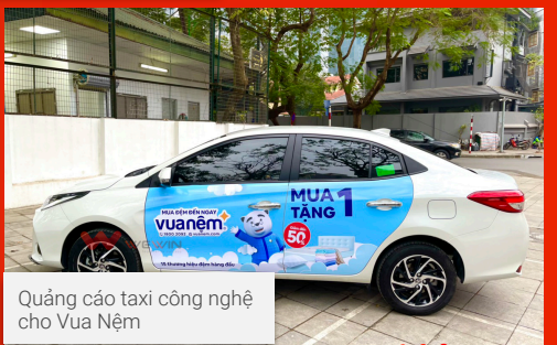
Quảng cáo taxi công nghệ cho Vua Nệm