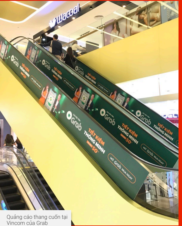
Quảng cáo thang cuốn tại Vincom của Grab