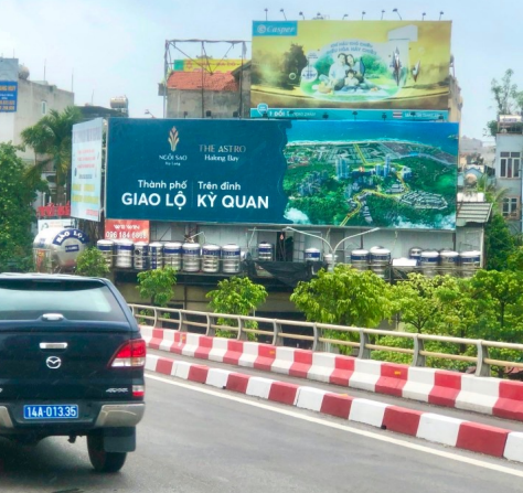
Billboard quảng cáo của BHS Group tại Hạ Long